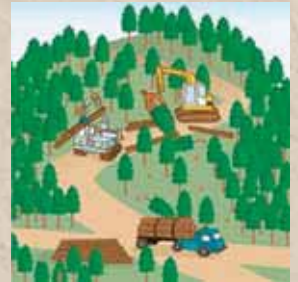
適切に森林整備を推進！

ことから、森林の土地の所有者の把握を進めるため、平成24年4月から森林法に基づく森林の土地の所有者となった旨の届出制度が創設されました。なお、この届出により、森林の土地の所有権の帰属が確定されるものではありません。